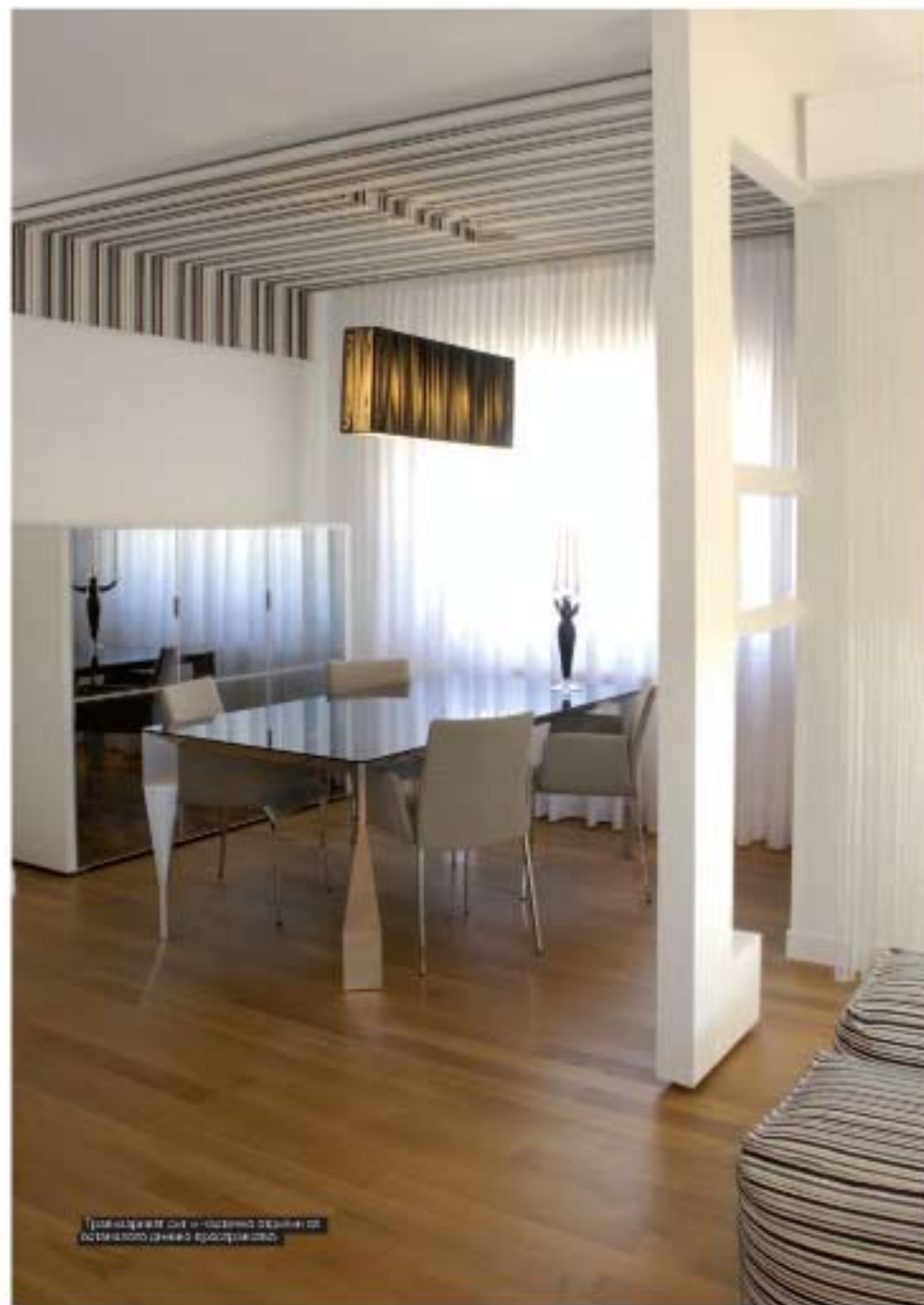
Триизмерен свет и сложна структура от бялото дъabbo в обедната зона.