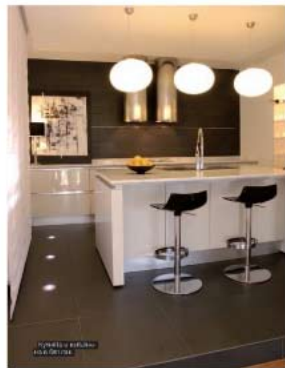
Кухнята е изпълнена със Suedico.

Трапезарията и кухнята са разположени непосредствено една до друга. Разделението им е по скоро условно. Така всяка зона може да функционира самостоятелно. Кухнята е на Suedico. Осветителните тела в цялата къща са от Vetrodesign.